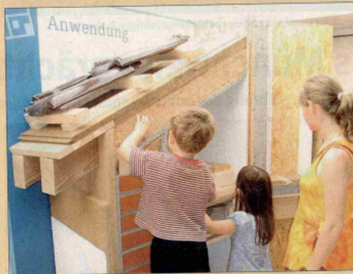
Die Wanderausstellung „BAUnatour“ schafft die Möglichkeit, nachwachsende Rohstoffe mit allen Sinnen zu entdecken.

wachsenden Rohstoffe beim Bauen und Wohnen. Die Wanderausstellung versteht sich zusätzlich als „Mini-Öko-Baumesse“ und bietet daher auch regionalen Anbietern die Gelegenheit, ihre Leistungen und Produkte im Umfeld der Infobox vorzustellen.